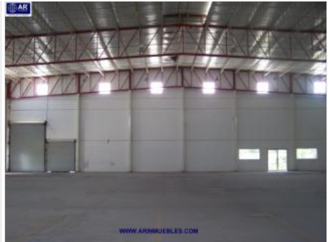
Lámina calibre 24 en nave KR18 engargolada (sin pijas) Aislante fibra de vidrio de 3" de espesor en nave R-11 Sin tragaluces y con cumbrera de convección