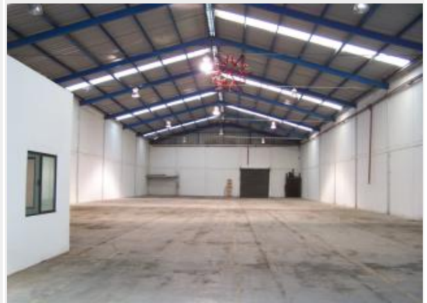
VISTA ORIGINAL DEL FRENTE HACIA ATRAS