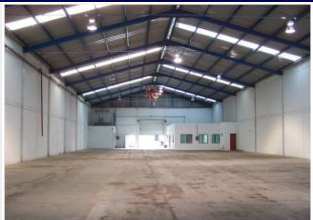
VISTA ORIGINAL DE ATRAS HACIA EL FRENTE

CUBIERTA Iluminación natural con 5% de lamina acrílica. lamina galvanizada