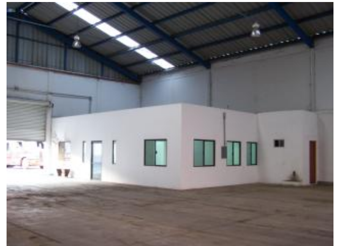
VISTA ORIGINAL DE OFICINAS