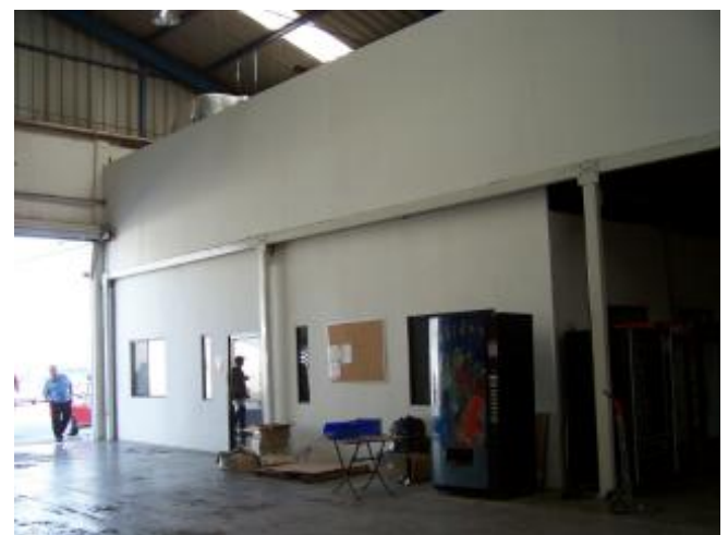
VISTA ACTUAL DE OFICINAS, SE AGREGO 2o. PISO